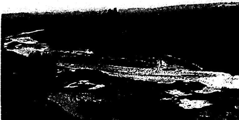
1. Η κοιλάδα του Ευρώτα

Οι Δωριείς κυριάρχησαν με τη δύναμή τους σε διάφορα μέρη της Πελοποννήσου. Πολλοί από